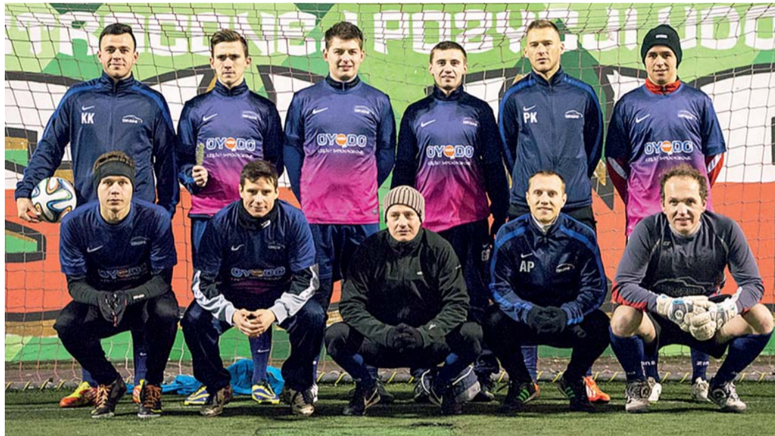
Na obydwu zdjęciach mistrzowie Car-Zone Wrocław.