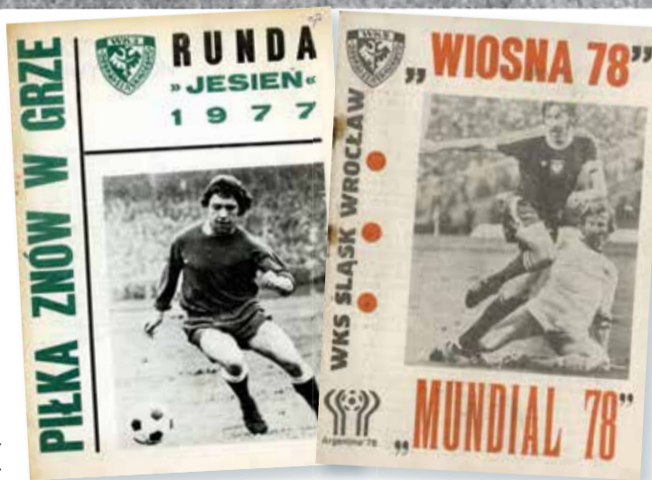
TABELA SEZON 1976/77